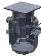
Abb.: Artikel 99 601.002B