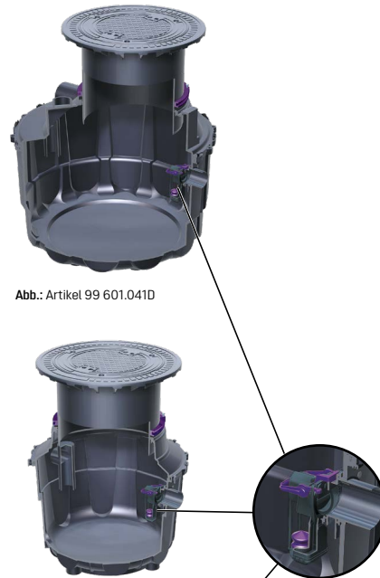
Abb.: Artikel 99 601.041D