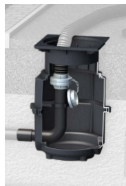
Entsorgungsschacht LW 400