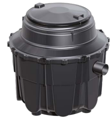
Abb.: Artikel 93 001

➤ Zubehör für NS 2/NS 3/NS 4: Probenahmeeinrichtung, Hebeanlage, Füllleinrichtung, Schauglas, SonicControl ab Seite 322