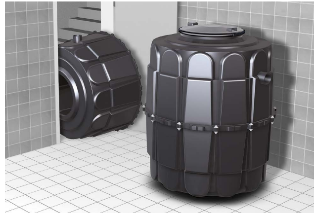
Abb.: Artikel 93 002-R