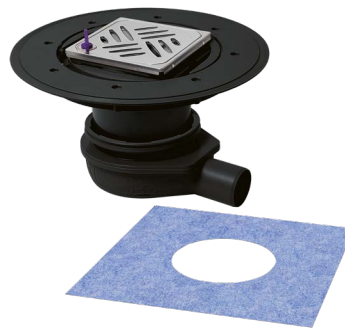
Abb.: Artikel 44 700.53 mit Lock & Lift -Verriegelungssystem